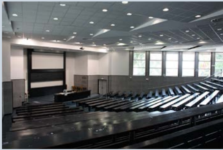
Amphithéâtre 2000 Site TROTABAS